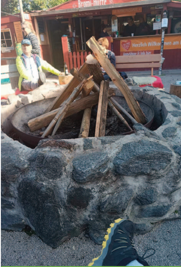
Bei Lagerfeuer und Musik kann man einen schönen Abend verbringen

In der Pension haben wir gefrühstückt und abends haben wir dann selbst überlegt, was wir machen. Da sind wir auch ins Lokal gegangen. In einem kleinen Dorfladen haben wir uns auch selbst was zum Essen gekauft.