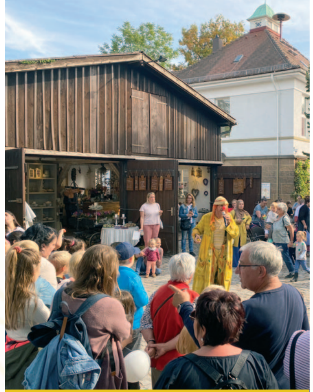
Großer Zuspruch – Jahresfest im Quartierszentrum

Es ist nicht gerade der schönste Fleck in Heilbronn. Nahe an der Ausfallstraße zur A6 und nach Neckarsulm. Autohäuser, Motorradhändler, Tankstelle, ein Bordellbetrieb, LIDL, russischer Supermarkt, ein Hotel, Kleingewerbe, die Wartberg-schule, die Nikolaigemeinde, viel Wohnraum und natürlich Burger King. Etwas weiter westlich im Viertel, geteilt durch die Bahntrasse, finden sich das Hawaii und die Industrie. Der Hochschulcampus beginnt da ein wenig an der robusten Fabrikästhetik zu knabbern. Ein Stückchen Richtung Osten wird es